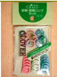
◎段數計環：計數的時候很方便。