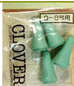
棒針固定器：用於棒針兩端的固定套，避免脫針。 ◎綠：適用 0~8 號針