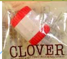
◎目數段數計： 覺得沒那的好用，目數段數計數器比較好用。