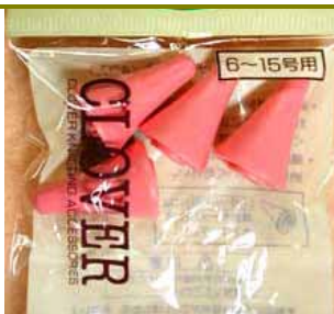
棒針固定器：用於棒針兩端的固定套，避免脫針。 ◎紅：適用 6~15 號針