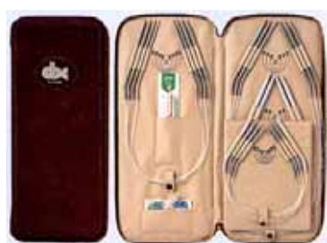
針和管子能自由組合使用的更換方式。

依需求不同，可選擇不同長度之輪針，例如：編織袖子部分，可選擇 30 公分的輪針。編織帽子時，可選擇 40 公分的輪針。