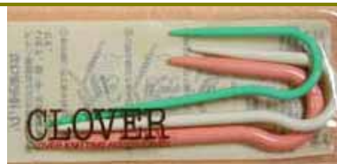
◎U 型麻花針：U 字部分將織目鉤住的設計.使用於愛爾蘭花樣等的交叉花樣